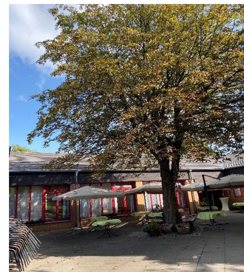
Innenhof Zentrum 60plus